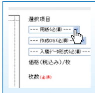
フォームにご入力