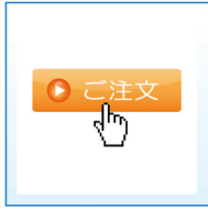
ご注文ボタンをクリック